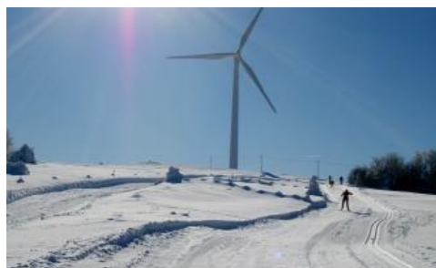
Parc de Chamlonge