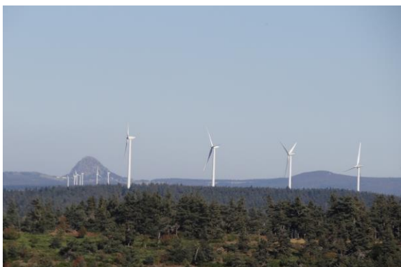
Parc du Cros-de-Géorand au dernier plan; parc de St Cirgues en Montagne au second plan