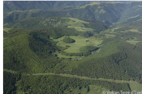
La Vestide du Pal